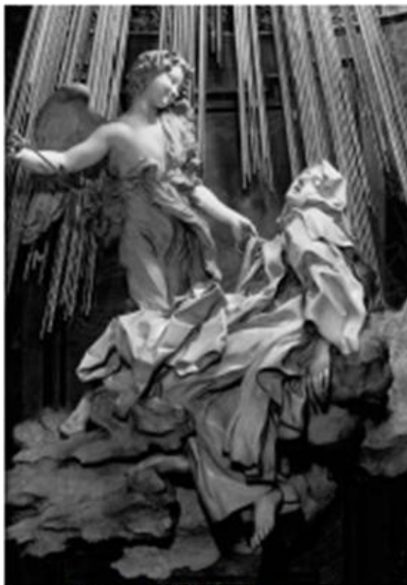
Giovanni Lorenzo Bernini, Ekstaza św. Teresy